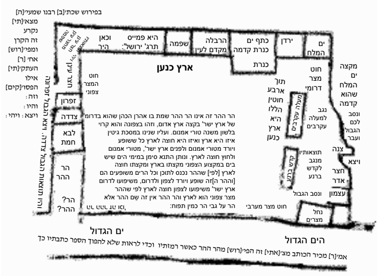
איור 1: מפת תחומי הארץ בכ"י לייפציג, ספריית האוניברסיטה B. H. 1