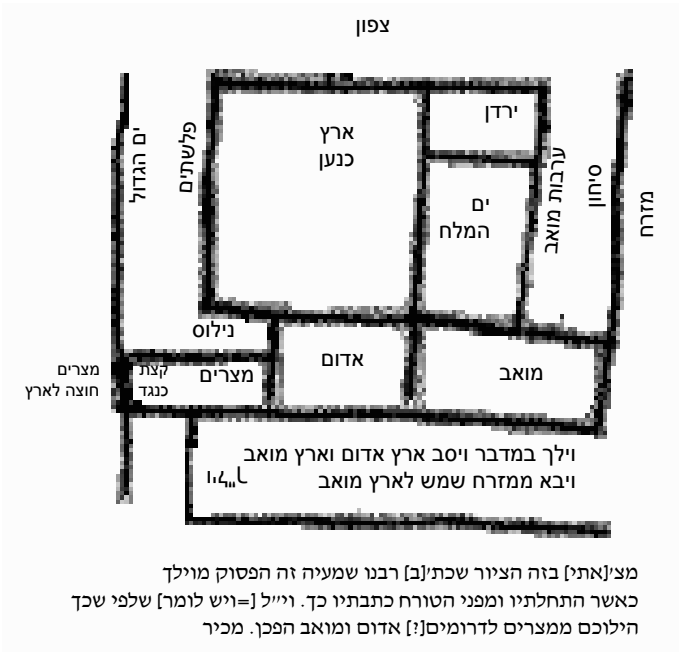
איור 3: מפת הארצות הגובלות בכ"י לייפציג 1 (בתחתית המפה הערת מכיר)